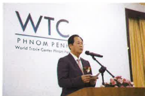
Chea Sophara 上級大臣ご挨拶