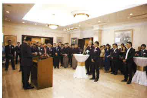
カンボジア、日本経済人に多数ご参加いただいた式典