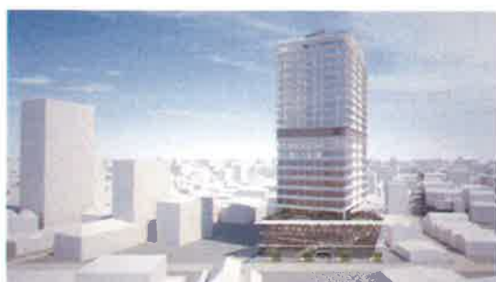
建物外観（イメージ）