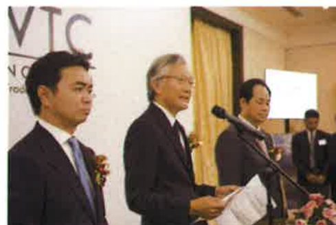
堀之内秀久 特命全権大使ご挨拶（写真中央）