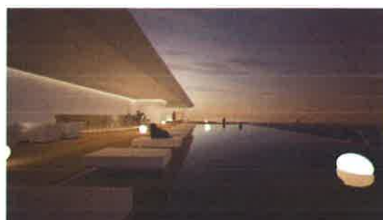
ルーフトップバー（イメージ）